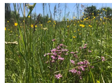
Orchis à fleurs lâches