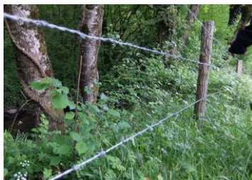
Haie et biodiversité