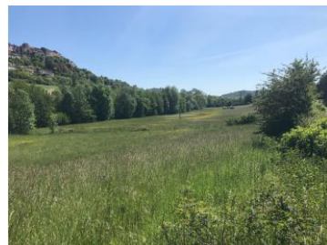
Fauche et ressource fourragère