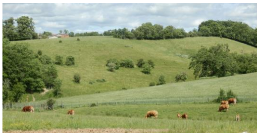
Pâturage et ouverture du milieu