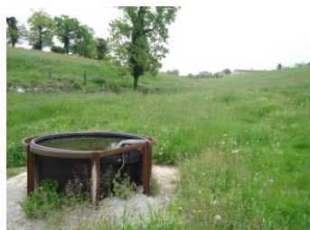
Abreuvement et qualité de l'eau