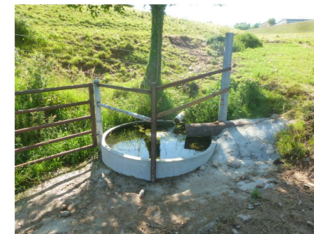
Bac gravitaire - commune de Moulaires

Il en existe plusieurs formats en fonction du type et du nombre d'animaux. Cet aménagement est adapté à des parcelles en pente (> à 1%). L'eau s'écoulera du point haut (ruisseau) vers un point bas (bac).